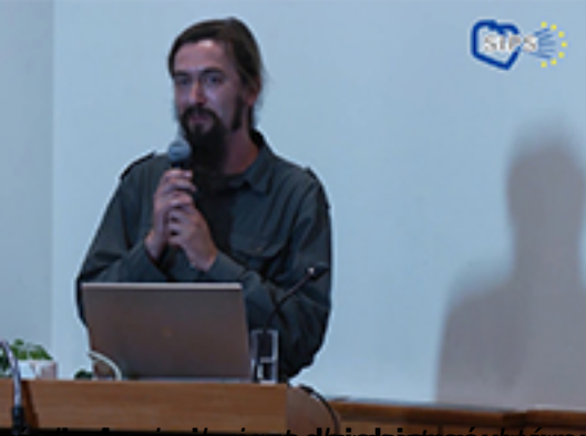
Doświadczenia przedsiębiorców w procesie inwestycyjnym na etapie projektowania i budowania